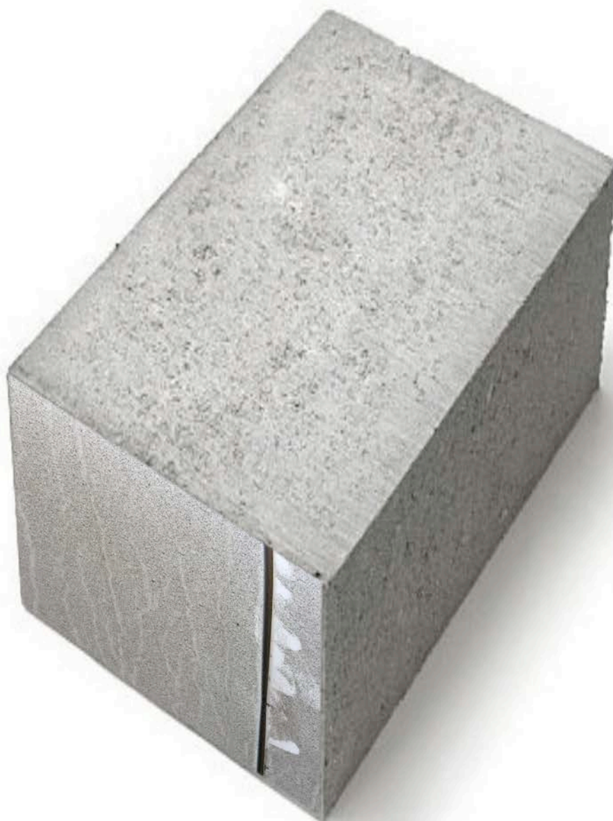
Horst Stein SMUZ 2, 2017 Foto, kaschiert auf Betonblock, ca. 20 x 20 x 30cm © Stein