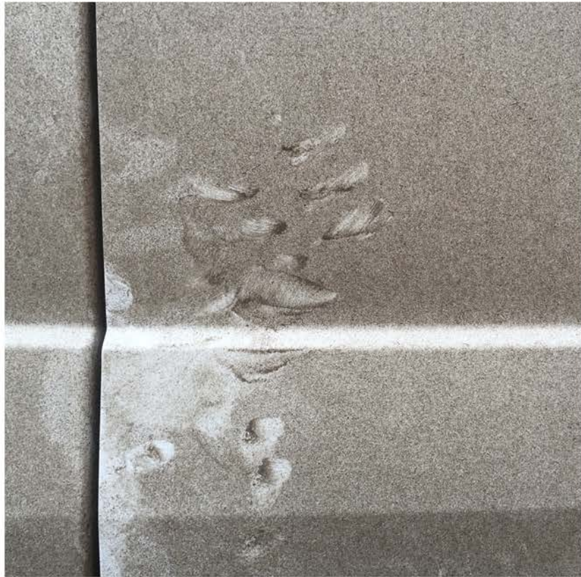
Horst Stein SMUZ 2_02, 2017 Foto, kaschiert auf Betonblock, ca. 30x30x50cm