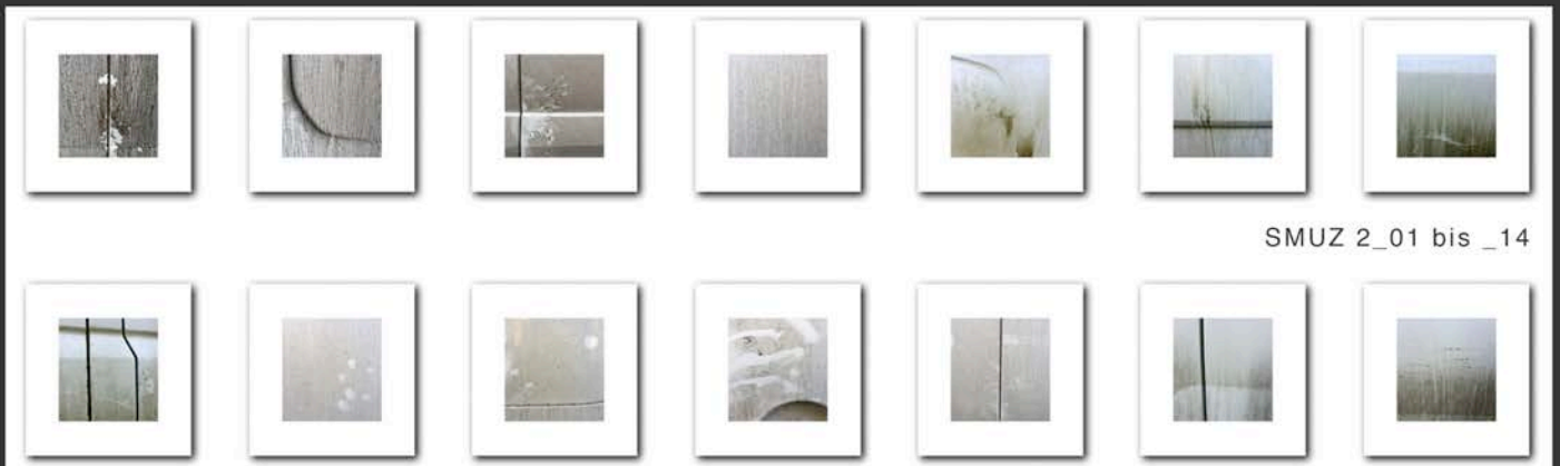
SMUZ 2_01 bis _14