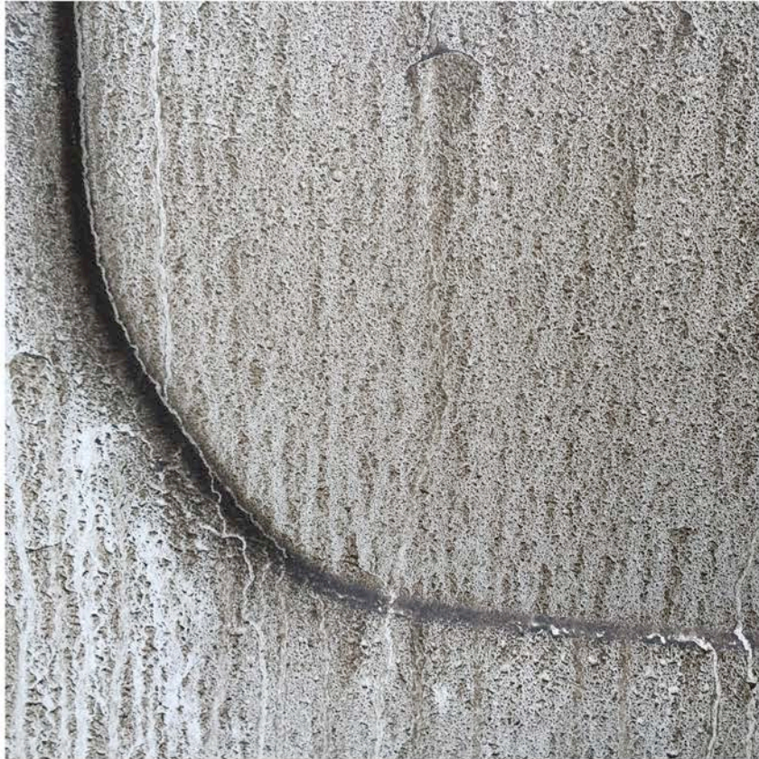
Horst Stein SMUZ 2_01, 2017 Foto, kaschiert auf Betonblock, ca. 30x30x50cm © Stein